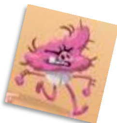
L'Armée de Tatie Truc Troc : le martien, deux bœufs, trois Dracula, quatre pirates, cinq zingues, six fusils et sept nuages de tempête